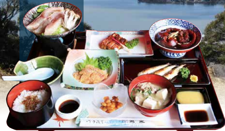
※料理写真はイメージです