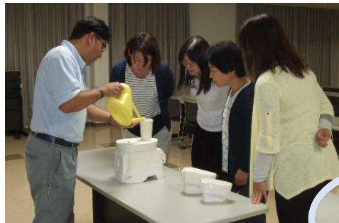
ミニチュア便器製作実演