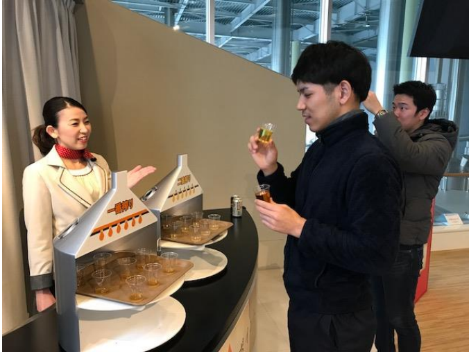
一番搾り麦汁と二番搾り麦汁の飲み比べができる