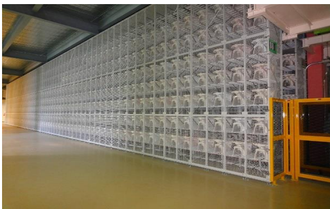
検査に合格した製品を保管する立体倉庫