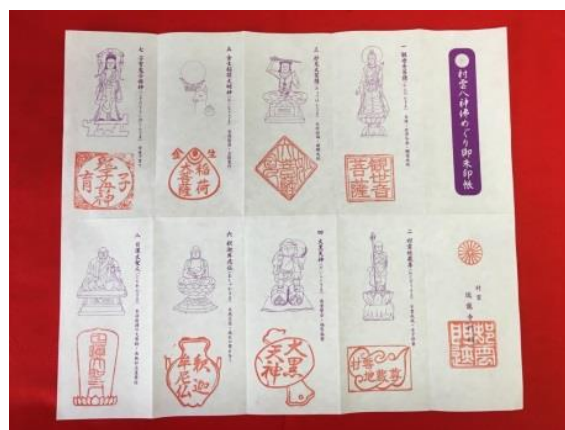
「村雲八神佛めぐり御朱印帳」

村雲御所瑞龍寺門跡の本堂内 6 ヲ所※にある村雲八神佛をお参り頂きながら、御朱印を押印していただけます。