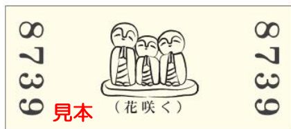
「～合格祈願～ 上り(のぼり)/城址(じょうし) 記念券」