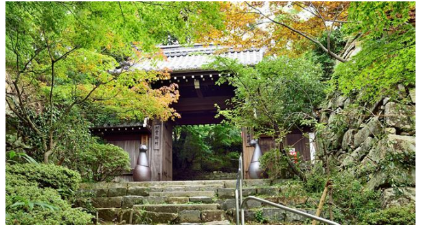
村雲御所瑞龍寺門跡

村雲御所瑞龍寺門跡は 1596 年（文禄 5 年）、豊臣秀次の生母（秀吉の姉）日秀尼公により、秀次の菩提を弔うため、後陽成天皇から瑞龍寺の寺号と京都村雲の地に賜り創建され、1961 年（昭和 36 年）に京都より この八幡山へ主要建物が移築されました。日蓮宗唯一の門跡寺院です。