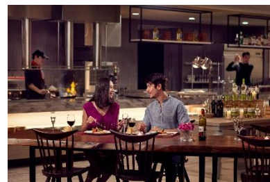
Grill & Dining G