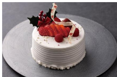
生クリームデコレーション

しっとりとした風味豊かなスポンジに、きめ細やかで軽さとコクをあわせ持つ生クリームを重ね、糖度の高い滋賀県産「蜂蜜いちご」をトッピングしたショートケーキ。軽い口当たりのクリームがいちごの爽やかな甘さを引き立たせる上質な味わいをお楽しみください。