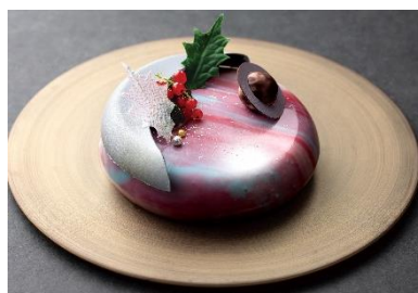
ノエルプラネット

プラネタリアムの星の世界を表現したチョコレートで包まれたケーキ。色鮮やかで見た目にもおしゃれなチョコレートの中はアーモンドのスポンジに、柚子のコンフィチュールをホワイトチョコレートのムースで包み込みました。柚子の酸味をアクセントにした爽やかな味わいの一品です。