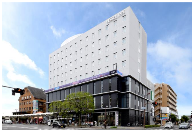
COCOTTO MORIYAMA <外観>