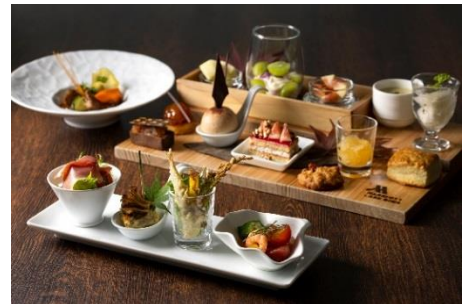
イブニングハイティー“Autumn Harvest”