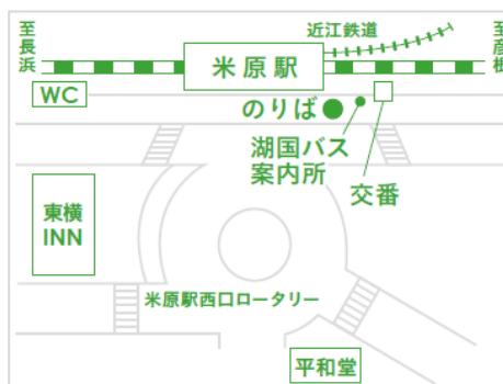
乗り場案内図(米原駅西口)