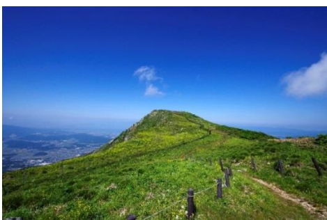
滋賀県最高峰の伊吹山