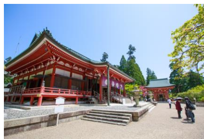
比叡山延暦寺 大講堂