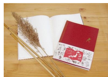
「ヨシ」と「たびあと」ノートイメージ

滋賀県にノート工場を構えるコクヨ工業滋賀が展開する「びわこ文具」は、琵琶湖のシルエットをモチーフとして取り入れた、お土産でも人気の高いシリーズです。本プランで特典として提供する「たびあと」ノートは、紙に琵琶湖の環境を守る植物「ヨシ」を使用し、風合いのある紙質、色合いで御朱印やサインが映える仕様です。