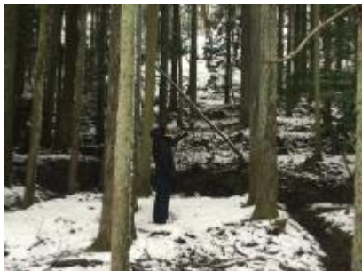
余呉湖の木立の中「風の音」を収録する様子

ドローンカメラで撮影した映像やタイムラプス映像は驚きました。琵琶湖はやはり大きいのだと再確認しつつ、こんなに様々な色がずっと毎年めぐっていることに感動しました