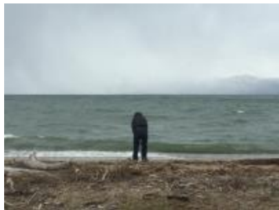
東近江で琵琶湖の波の音をとる模様