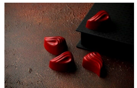
巨峰と赤ワインのボンボンショコラ イメージ