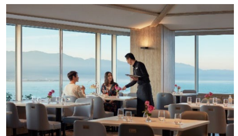
Grill & Dining G イメージ