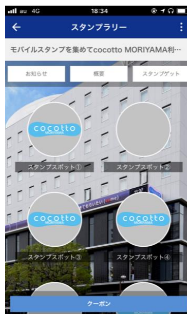
モバイルスタンプ画面（イメージ）