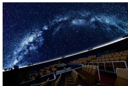
デジタルスタードーム ほたる