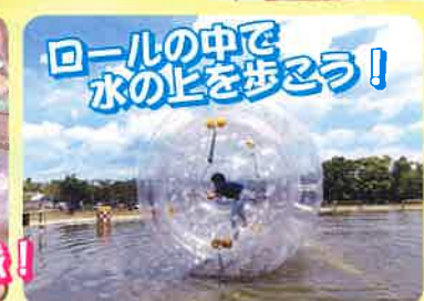
ロールの中で 水の上を歩こう！