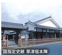
国指定史跡 草津宿本陣