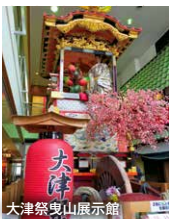
大津祭曳山展示館