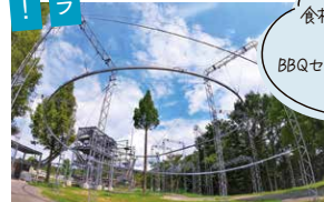
滋賀農業公園 ブルメの丘のスタッフさん

食材も道具も準備不要な 手ぶらで楽しめる BBQセット(2~3人分5,000円)も ご用意しています