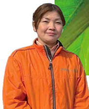
道の駅 アグリパーク竜王の スタッフさん

※事前予約! 体験時期 例年 5月下旬~6月上旬 「竜王のさくらんぼ」は 甘みと酸味のバランスが抜群! 屋根付きハウスで、 天気を気にせず体験できます