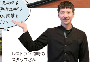
レストラン岡崎のスタッフさん