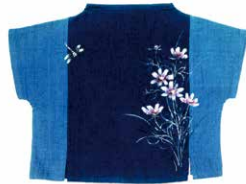
藍染手描きブラウス25,300円～(税込)

近江八幡・八幡堀沿いの大正時代の古民家に店舗があります。藍染・墨染・柿渋染の先染め綿布にオリジナルの手描きを施した洋服や布小物を主に製作・販売。定番商品をイージーオーダーで承っています。着やすく楽しんでいただける一点物ばかりです。