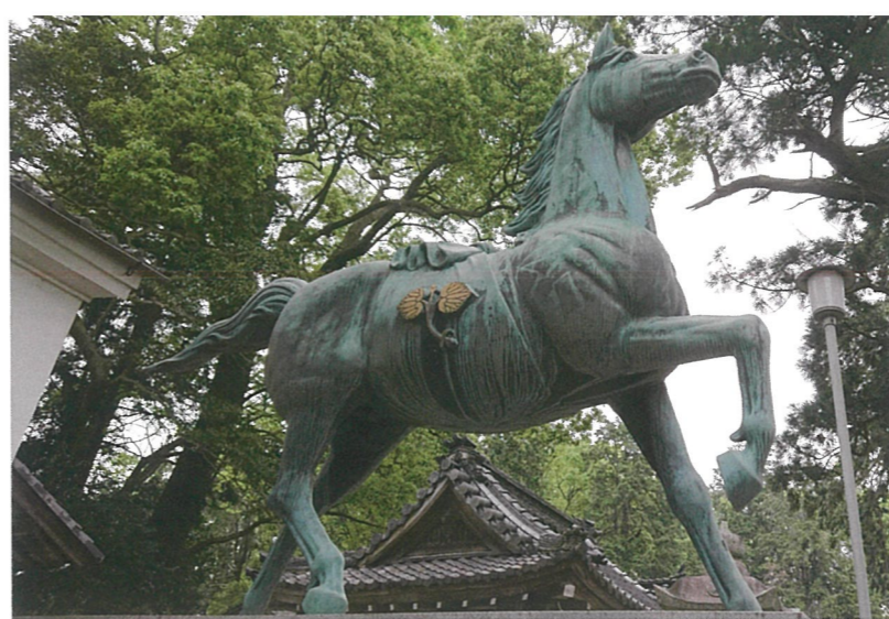
境内には日本一の神馬像があります

騎乗する者は、古来の二種類の舞楽姿になります。それぞれ赤と黒の素襦(すおう)に身を包み、烏帽子をかぶり、馬場にて行事に臨みます。足伏走馬の行事自体、農機具の発達などから馬を飼育する家が無くなったことを理由に一時縮小して行われていました。しかし近年では、県内の牧場に出走する馬の出演を依頼する形で復活を遂げ、古来の馬の行事を知る貴重な儀式として崇敬されています。