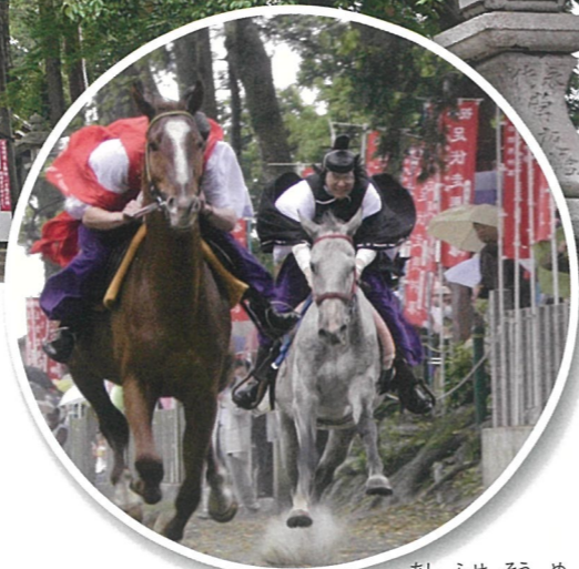
あしふせ そうめ 足伏走馬

全国唯一「馬・競馬・乗馬」守護神 馬の心を伝える日本最古の 全国唯一の神社であり日本の「馬の聖地」だ。