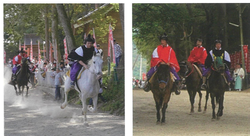
「足伏走馬」行事の様子