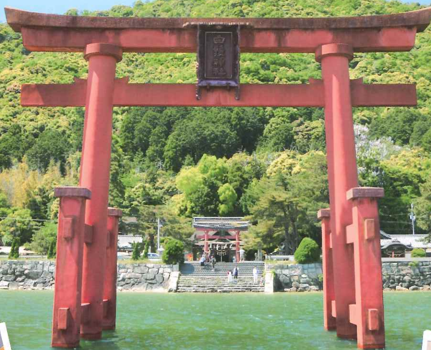
白鬚神社～湖中の大鳥居～