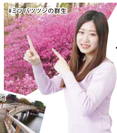
#ミツバツツジの群生