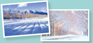
びわ湖高島観光ガイド 検索