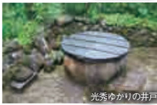
光秀ゆかりの井戸

所 犬上郡多賀町四手976-2 開 多賀町立博物館 電 0749-48-2077 料 16歳以上:200円(常設展示入場の場合) 休 毎週月曜日・毎月第3日曜日・祝日・資料整理日・年末年始・特別整理休館期間 近江鉄道「多賀大社前駅」下車 徒歩約25分