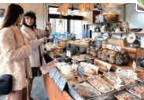
びわ湖産の魚介の加工品も並び