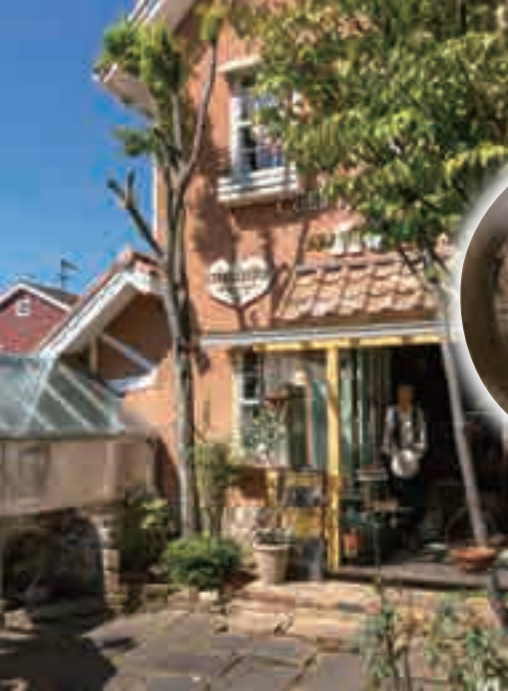
3 おしゃれな雑貨が並ぶ[noriaki]店内を抜け、Café je Jardinへ。光が差し込む明るい雰囲気