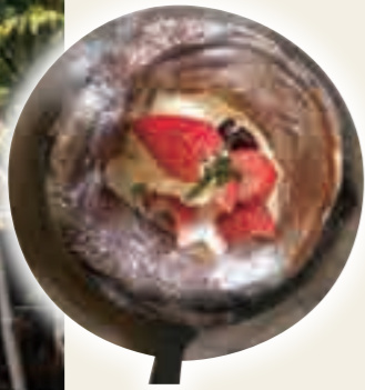
近江いちごなど地元の旬の素材を使った季節限定の「ダッチペイビー」も人気