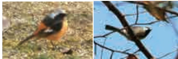
ジョウビタキ(渡り鳥) シジウカラ

所 栗東市安養寺178-2 ☎ 077-554-1313 時 9:00~16:30、4月~9月は17:00まで 休 月・火曜(祝休日の場合は翌平日)、祝日の翌日(土・休日・休園日の場合は翌平日)、12月28日~1月4日 無料(ネイチャーセンターにて受付要) 交 JR東海道本線(琵琶湖線)「草津」駅から帝産バス「赤坂団地」下車 徒歩約5分