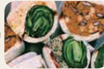
野菜たっぷりNICOLAOの「パン・ド・ミ」

滋賀に魅了されて移住したというオーナーが手がけるのは、草津特産「愛彩菜」などの野菜や、地元農家で作られた旬のフルーツをはさんだボリューム満点なサンドイッチ。おいしくてSNS映えすると好評で、挽きたて、淹れたてのコーヒーともよく合います。