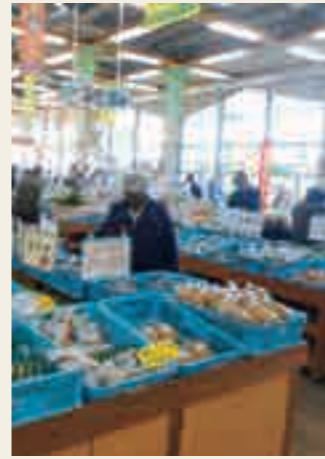
「草津あおばな館」の直売所