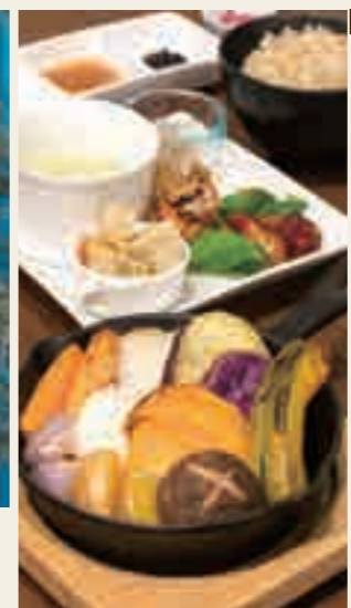
米も野菜も自然栽培にこだわったというオモヤキッチンの「季節野菜のグリル」

ちなみに店名の「オモヤ」は「母屋」に由来するそうで、老若男女問わず、みんなが集まる場所を目指しているのだとか。落ち着いた感じの店内は、なんだかほっとあたたまる雰囲気に包まれていました。