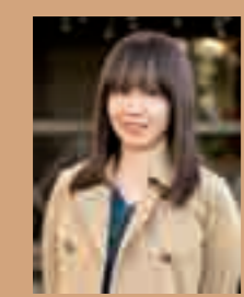
【執筆】砂野加代子 すなの・かよこ

京都在住フリーライター。滋賀県彦根市出身。旅や食、教育などのテーマで執筆・編集。関西のカフェや遊び場・京都関連の書籍、雑誌、Web等で取材多数。