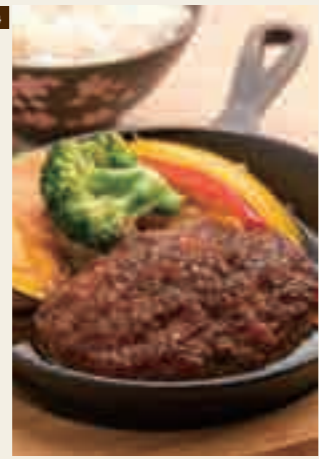
自然あふれる風景を眺めながら味わえるRotiの「認定近江牛ハンバーグ」