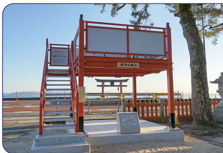
鳥居の写真を撮りたい方は、展望台をご利用ください。

行楽シーズンは多くの車や歩行者が通行します。ほんの少しの気持ちのゆるみがおぼろげな事故につながります。交通ルールを守り、マナーアップに心がけ、楽しいサイクリングにしましょう。