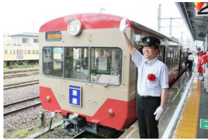
出発式のイメージ

観光キャンペーンのPR車両である『虹色の旅へ。滋賀・びわ湖 ラッピング列車』の出発式を実施し、観光キャンペーンのPRを行います。