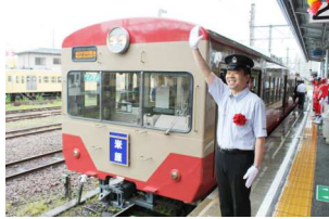
出発式のイメージ

観光キャンペーンのPR車両である『虹色の旅へ。滋賀・びわ湖 ラッピング列車』の出発式を実施し、観光キャンペーンのPRを行います。