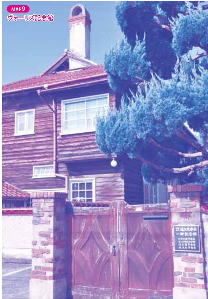
MAP9 ヴォーリス記念館