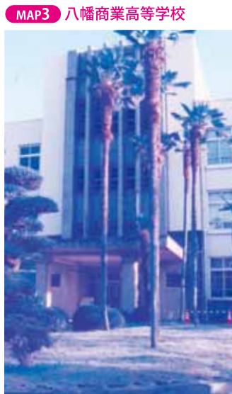
MAP3 八幡商業高等学校