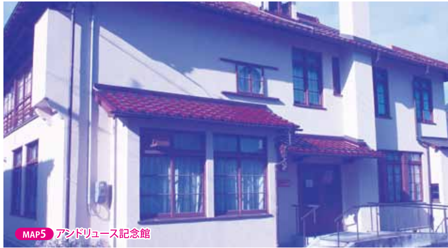
MAP5 アンドリュース記念館