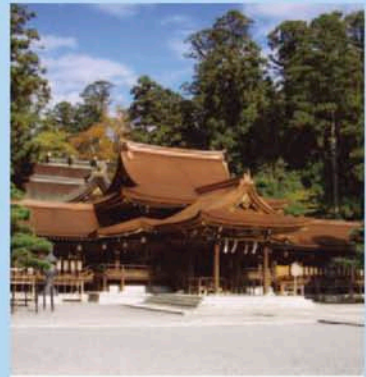
境内見学自由 無料(奥書院庭園 拝観料300円)

延命長寿・縁結びの神として信仰を集める神社。表参道には古き良き時代の建物と装い新たに生まれ変わった商店が建ち並び「絵馬通り」と呼ばれお参りの人々で賑わいます。